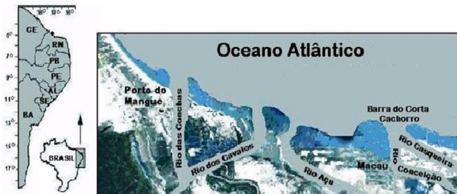
Figura 1. Principais rios do complexo estuarino de Macau - Rio Grande do Norte. Extração de Petróleo

A atividade petrolífera na região litorânea de Macau (em vilas rurais, áreas de salina e de atividade da pesca artesanal) é considerada uma das maiores produções nacionais de petróleo em terra (SANTOS, 2008). A atividade petrolífera vem sendo bastante estudada no Brasil, principalmente pelos conflitos e impactos socioambientais negativos causados em toda sua cadeia produtiva (HERNÁNDEZ e BERMANN, 2010). Em Macau, os recursos dos royalties apresentam baixa aplicação em investimento, não retornando, portanto, em forma de bens e serviços para o município e seus cidadãos (ROCHA, 2013).