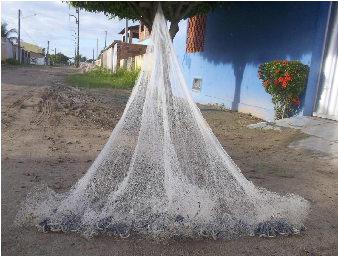
Figura 3. Tarrafa utilizada nas capturas de camarões peneídeos na área de pesca da SALINOR (Macau - Rio Grande do Norte).

A tarrafa (Figura 3), com malhas medindo em torno de 18 mm entre-nós opostos, circunferência na área da chumbada entre 19 e 30 metros e altura em torno de 6 metros, é o petrecho de pesca empregado, sendo a atividade realizada em dupla sem que se utilize qualquer embarcação para o deslocamento. Para a captura, os pescadores jogam metade da rede sobre o sedimento e arrastam-na manualmente, utilizando apenas uma das mãos, já que a outra segura a parte do petrecho que fica fora da água. Após cerca de cinco minutos arrastando a rede, jogam o restante da tarrafa na água para que feche o círculo sobre o sedimento, recolhendo a seguir o petrecho com o produto capturado no lance. Cada dupla pode realizar até 30 arrastos por noite, começando em torno das 18 horas e encerrando às 22 horas.